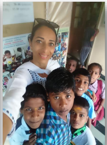
Sans oublier les jeux et les sourires avec « Sushila Mdam Best Friend ».