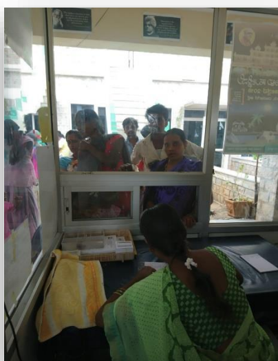
Enregistrement des enfants à la réception du France Inde Karnataka General Hospital d'Halligudi.