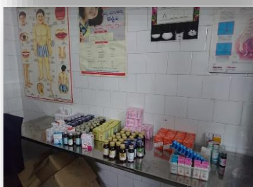
Installation des médicaments et de la banderole du camp dans la salle de consultation.